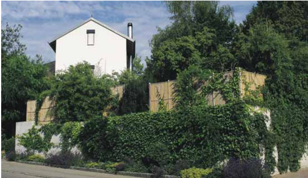
Wilder Wein und Efeu überwachsen die kahle Betonmauer, die in ihrer kühlen Nacktheit nicht zum neuen Gartenstil passt.