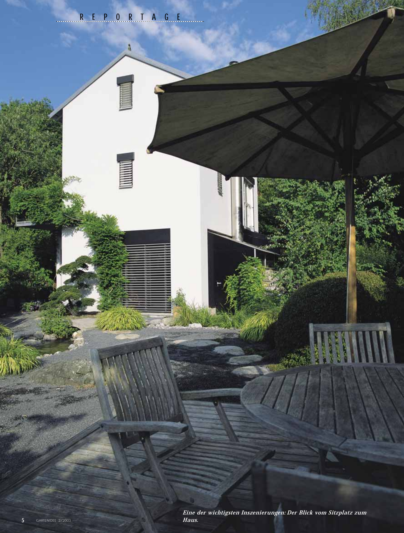
Eine der wichtigsten Inszenierungen: Der Blick vom Sitzplatz zum Haus.