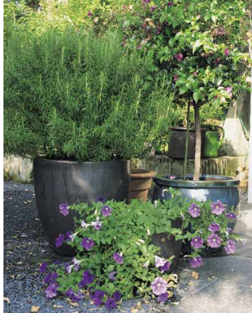
Auch Küchenkräuter, in Töpfen gepflanzt, finden Platz im Garten.

dern ein dialektisches Spiel von innen und aussen entstehen soll. Üppiger Bambus im Wechsel mit Bambuswänden vermittelt Halt, ohne einzuengen.