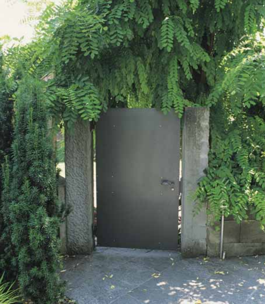
Das Gartentor, das in den Garten hineinreicht, schafft eine Verengung zwischen Gartenzonen.