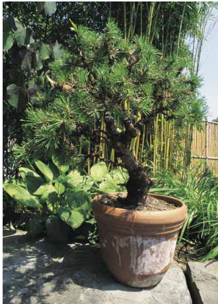
Topfpflanzen können immer wieder einen neuen Standort erhalten.