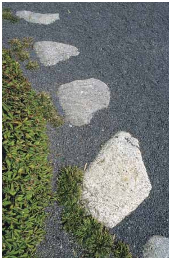
Die vielförmig gerundeten Trittsteine schwimmen auf einem Kiesmeer.