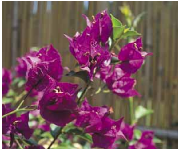
Mit Bedacht eingesetzt, überzeugen die in kräftigen Farben strahlenden Blüten.