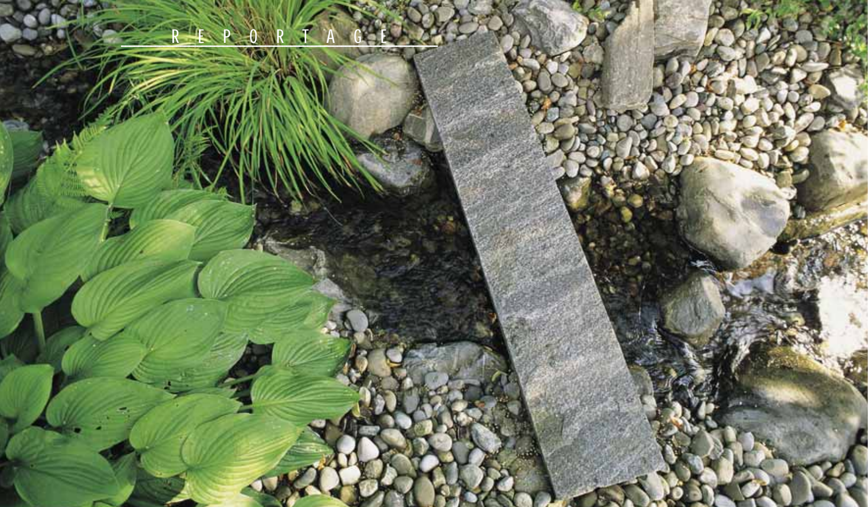
Eine Granitplatte dient als Brücke über das Bächlein.

D ie Besitzer des hier vorgestellten Objektes gingen die Neugestaltung des Gartens ganz systematisch an: Ein Studienauftrag an drei Gartengestalter zeigte verschiedene Lösungsansätze mit entsprechendem Kostenrahmen auf. Die überzeugendste Lösung enthielt folgende Elemente: Optische Vergrößerung des Gartens, Sichtschutz, Wasser in Form von Bächlein und Weiher, eine ausgewogene Bepflanzung sowie Sonnen- und Schattenplätze. Erst im Prozess vom Entwurf zur Umsetzung kristallisierte sich dann der fernöstlich inspirierte Garten, wie wir ihn jetzt vorfinden, als Leitidee heraus.