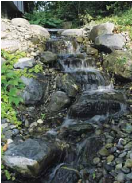
Ein kleines, vor sich hinplätschern- des Bächlein...