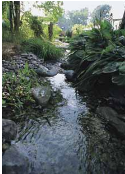
...wird zum etwas breiteren und ru- hig dahinfließenden Gewässer ...