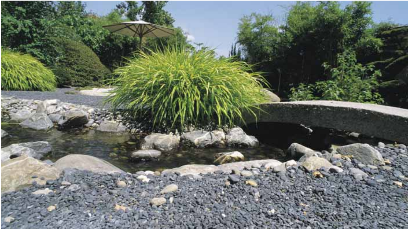
Das kleine Brücklein schwingt sich sanft und elegant über das unterbetonierte Bächlein.