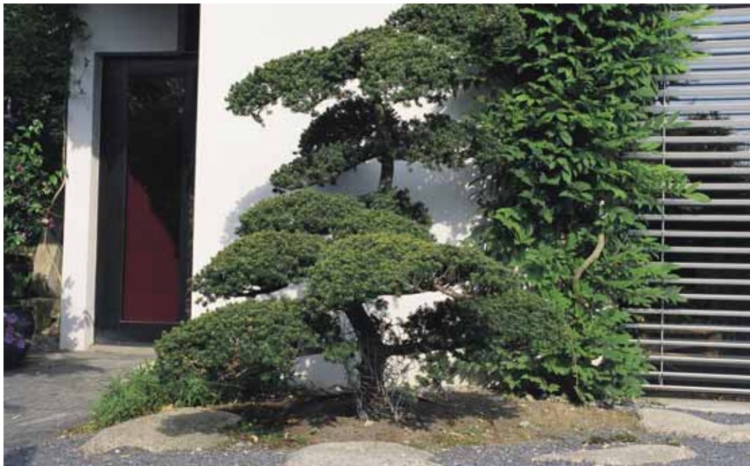
Entsprechend geschnittene Pflanzen lockern die moderne Hauswand auf.