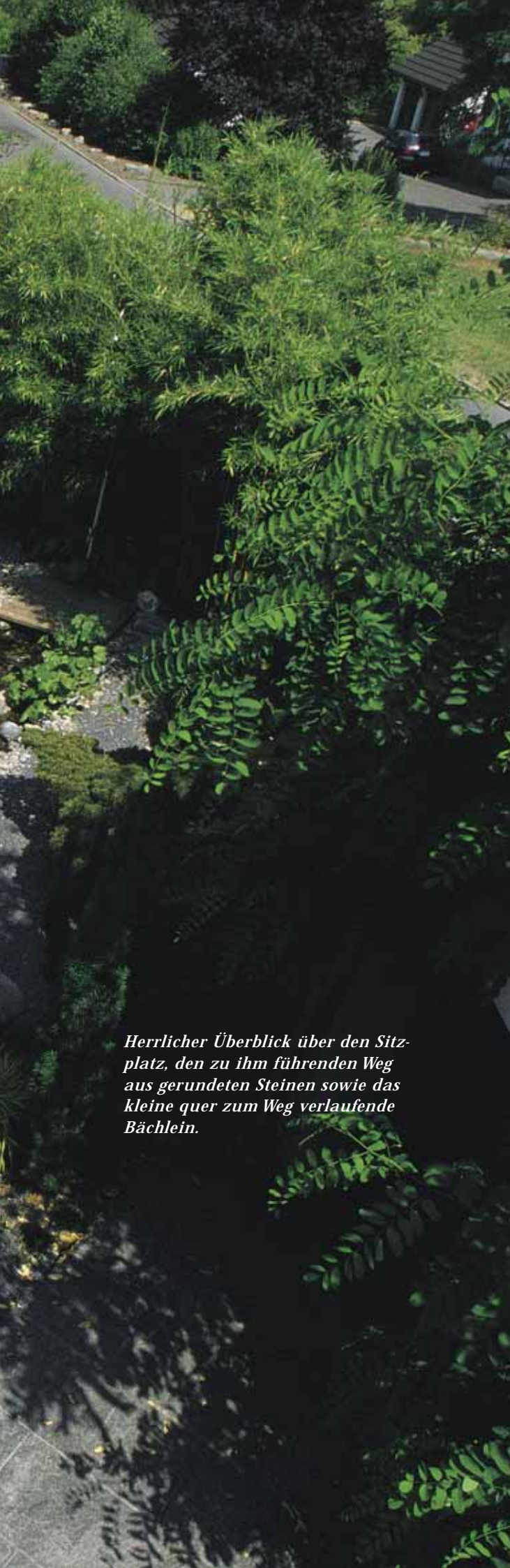
Herrlicher Überblick über den Sitzplatz, den zu ihm führenden Weg aus gerundeten Steinen sowie das kleine quer zum Weg verlaufende Bächlein.