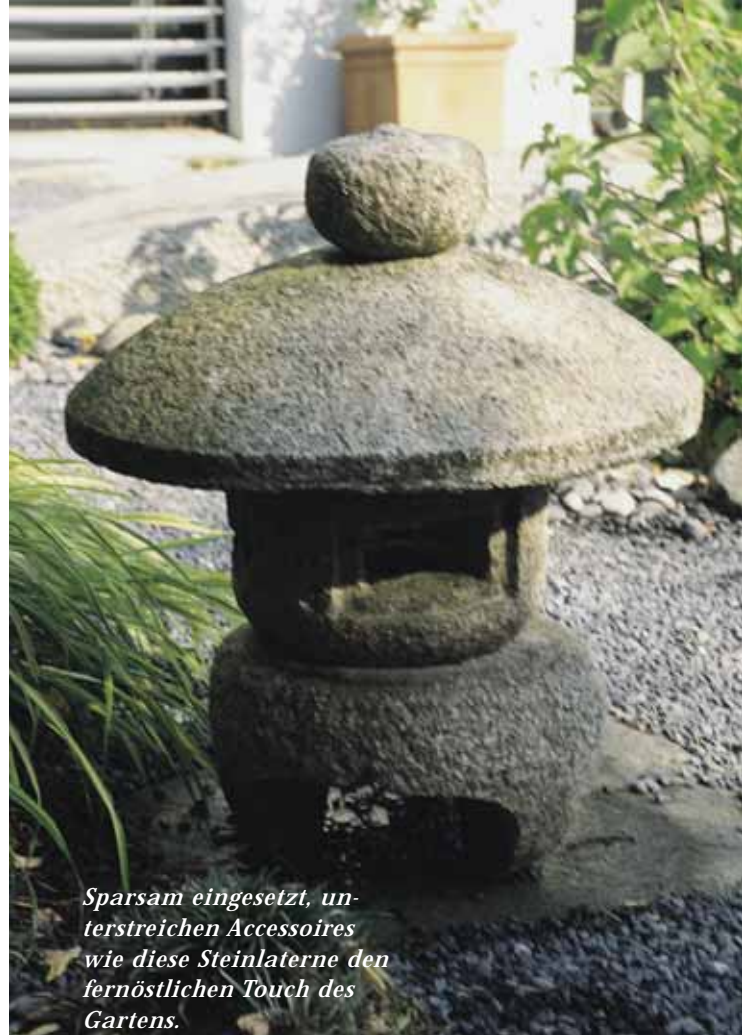
Sparsam eingesetzt, unterstreichen Accessoires wie diese Steinlaterne den fernöstlichen Touch des Gartens.