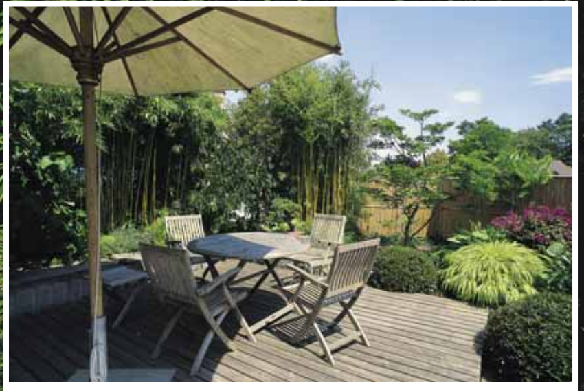
Die Pflanzenwahl verleiht dem Sitzplatz ein fernöstliches Ambiente.

Verengungen zwischen den Teilräumen schaffen Tiefenwirkung im sonst durchgehenden Gartenraum.