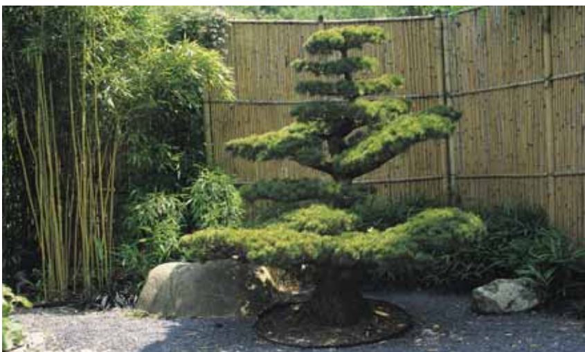
In Form geschnittene Pflanzen wie Mädchenhaarkiefer, Eibe und Prachtglocke ziehen die Blicke der Betrachter auf sich.