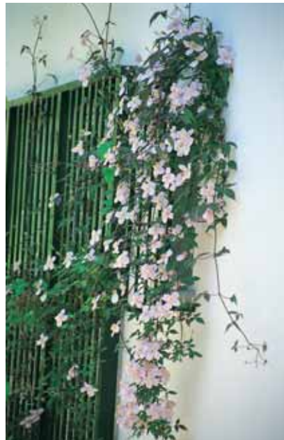
Eine Clematis überrankt die Fenstergitter.