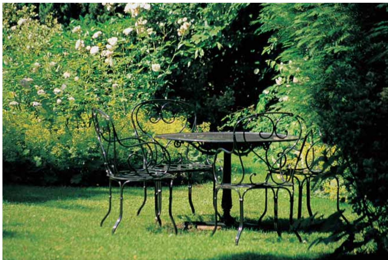
Weisse Strauchrosen umspielen diesen Sitzplatz im Grünen.