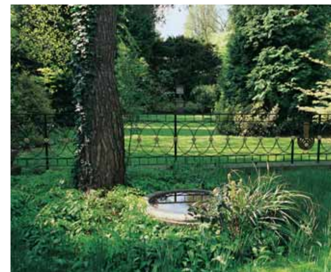
Das Vogelbad am Fuss der Föhre.