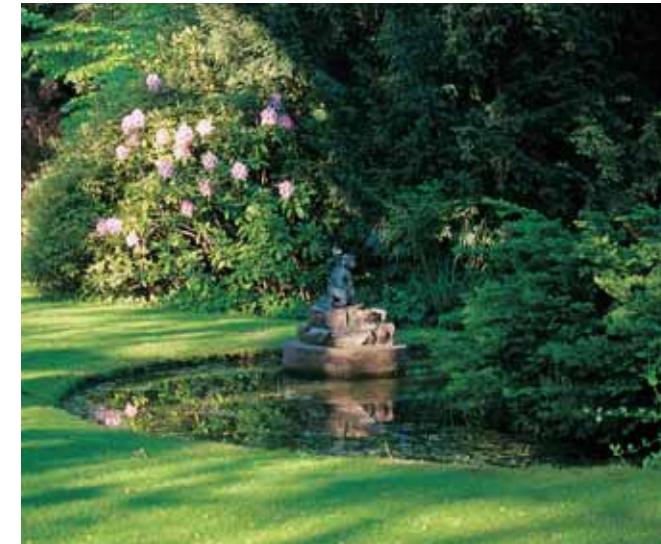
Das Wasserbecken spiegelt das Blau des Himmels.