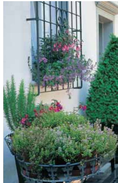
Sommerflor schmückt die Fenster.