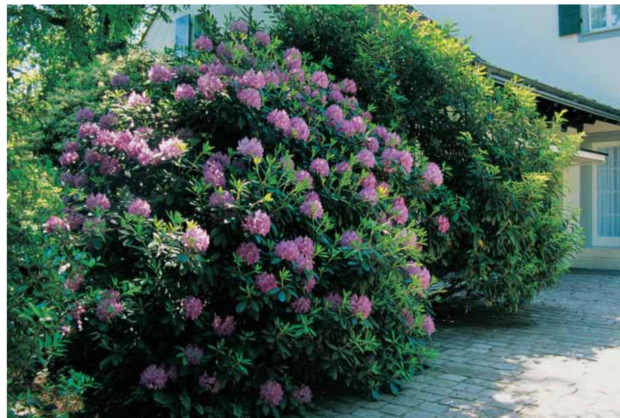
Rhododendren begleiten auf der Hauszufahrt.

Mitten in der Stadt Basel erstreckt sich ein Garten, der – wie eine Oase in der Wüste – von einem Ring aus Reihen- und Mehrfamilienhäusern umgeben ist.