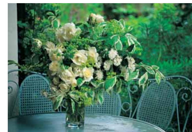
Ein Blumenstrauß aus dem weissen Garten.