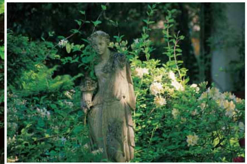
Skulpturen ersetzen die Aussicht in die Landschaft...