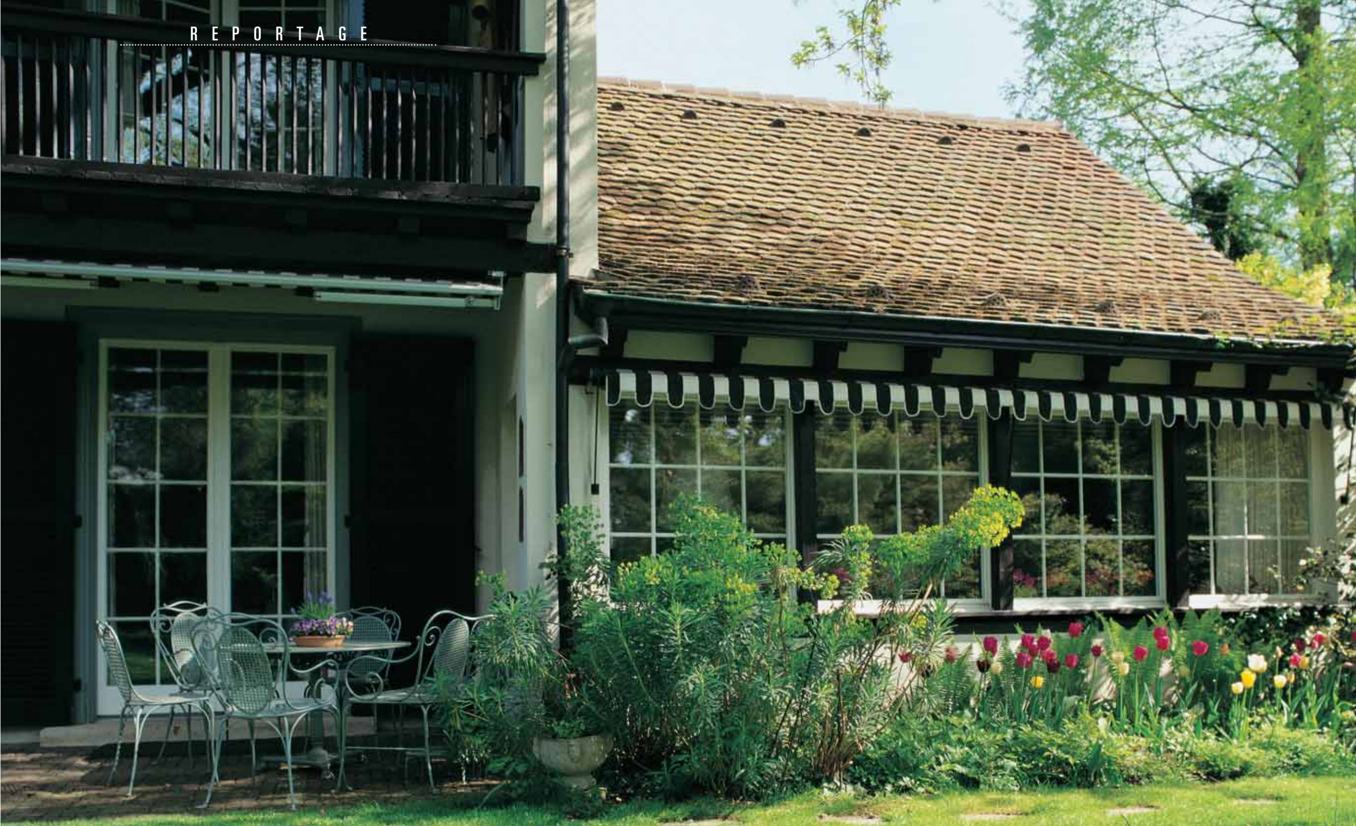
Der Landschaftsgarten harmoniert mit dem klassischen Landhaus.