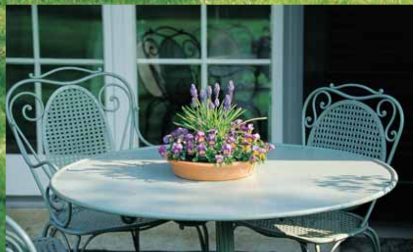
Schöne Gartenmöbel schaffen stimmige Atmosphäre.