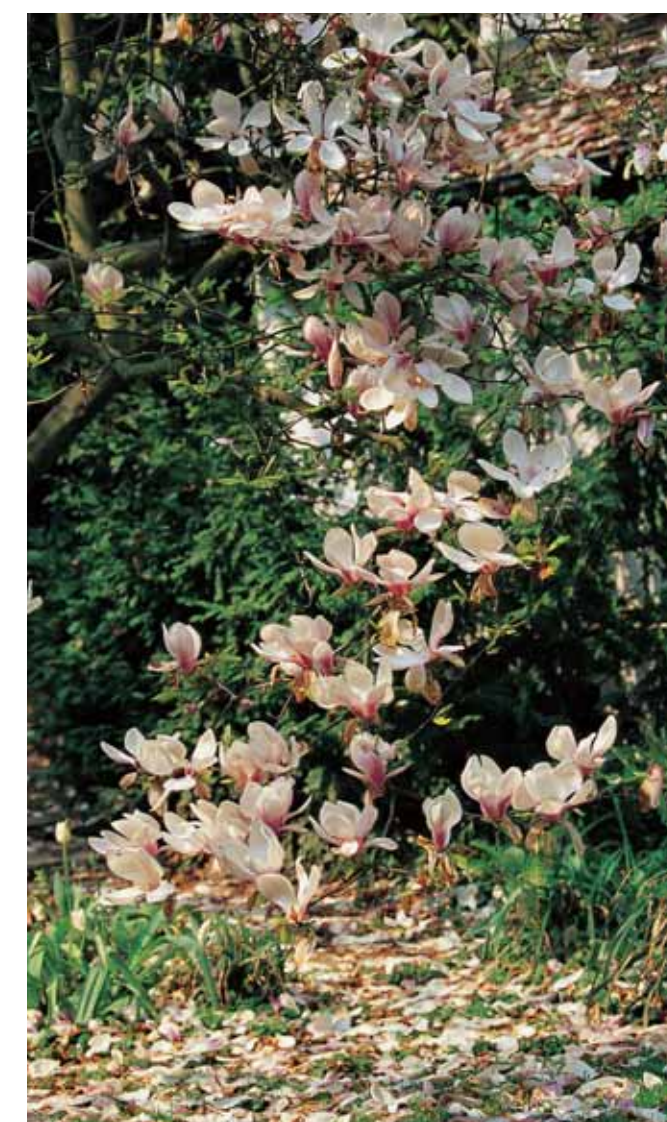
Die Baum magnolie im Mietergarten.