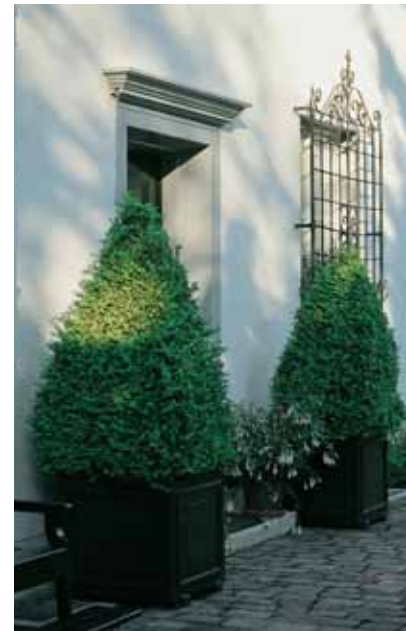
Zwei Buchskuben flankieren den Haupteingang.

henden Azaleen umgeben laden schöne alte Gartenmöbel zum Aufenthalt. Immer einen schönen Tisch decken zu können, bezweckt die Besitzerin nicht nur im Freiraum. Auch für das Haus schneidet sie jede Woche 10 bis 15 Blumensträuße. Wie das Tüpfchen auf dem i finden sich elegante Metallmöbel deshalb im ganzen Garten wieder. Sie stehen bei jedem Wetter draussen und werden nur im Winter eingelagert.