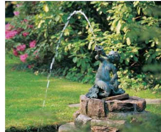
Ein Wasserspeier wälzt das Wasser um.