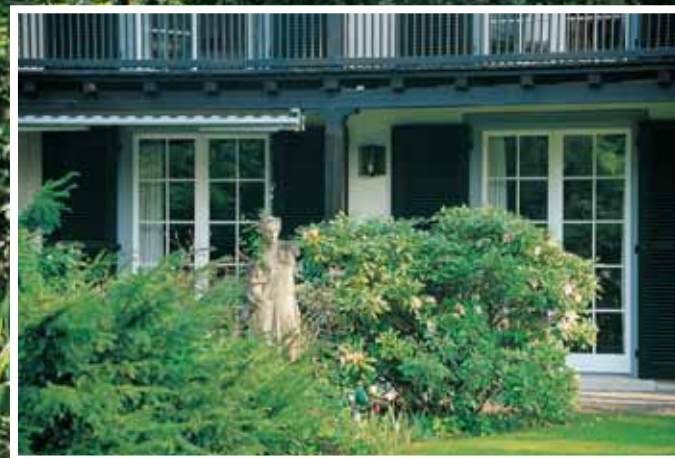
Der intime Sitzplatz vor dem Musikzimmer.