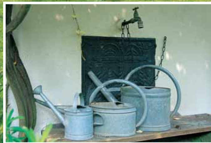
Die verzinkten Giesskannen als Stilleben..