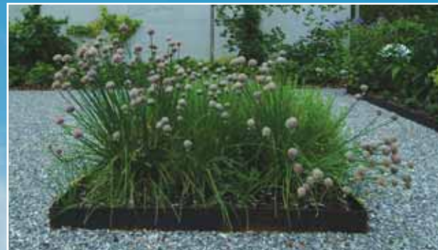
Metallumrahmter Pflanzbereich für Küchenkräuter.

Mit den drei Leuchtkugeln lassen sich immer neue Akzente im Garten setzen.