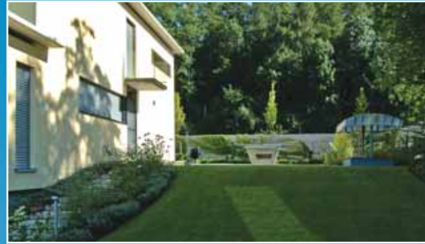
Sandkasten und Tischtennistisch in der Nähe der Küche.