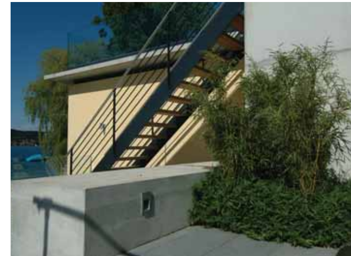
Bambus dient der Bepflanzung der Terrasse.