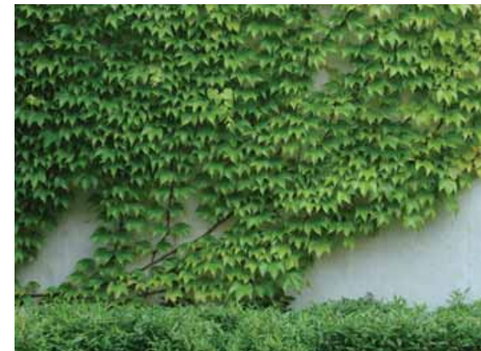
Bald werden grosse Teile der Betonmauer unter den Pflanzen verschwunden sein.