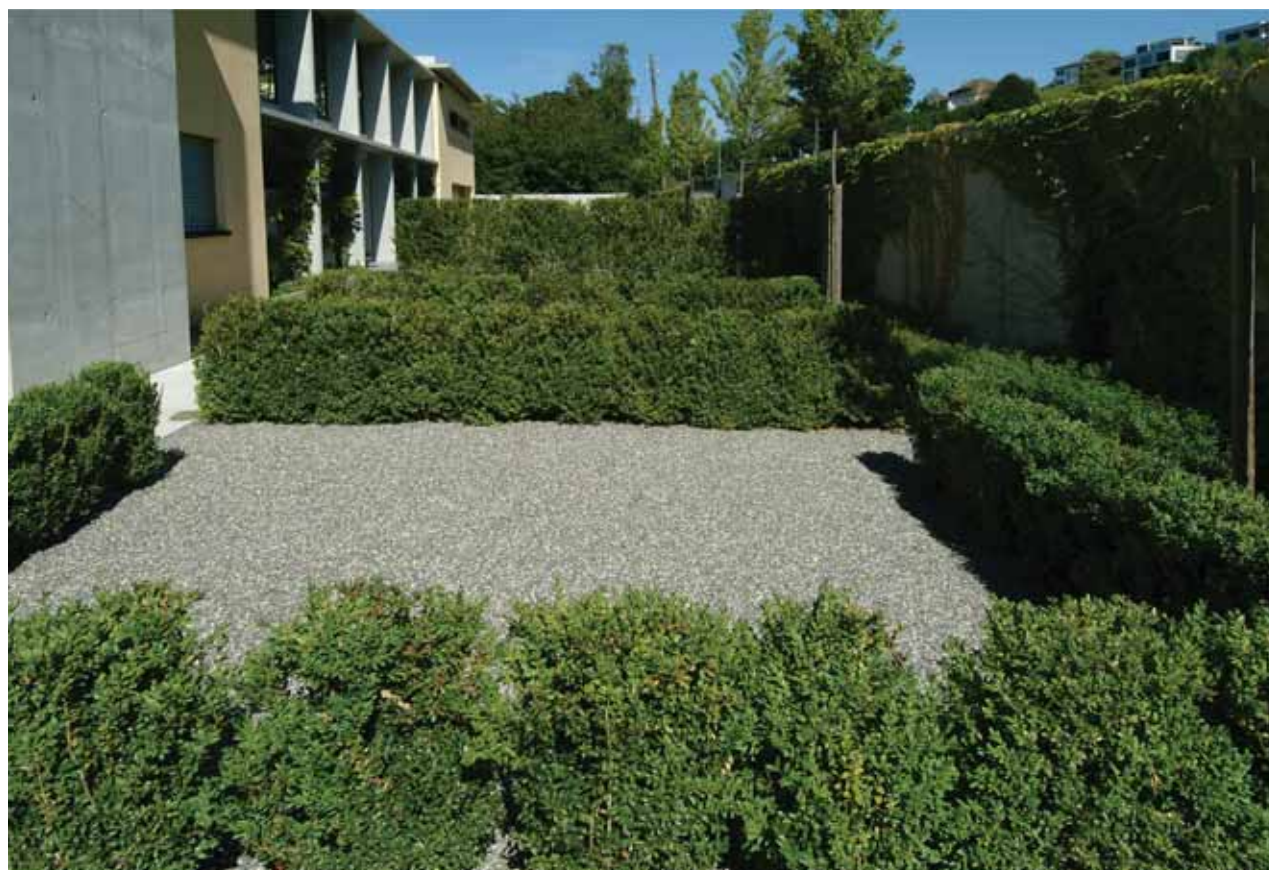
Mit Buchshecken eingefasste Segmente im hinteren Gartenbereich.

Zwischen der stark befahrenen Seestrasse und dem Bodensee erstreckt sich ein Grundstück, das gestalterisch eine Herausforderung darstellt. Nicht genug, dass die lang gezogenen Gartenräume und eine festgesetzte Uferlinie die Gestaltung einschränken, auch der Wasserstand des unkorrigierten Bodensees schwankt um mehrere Meter. Kommt erschwerend hinzu, dass in dieser herrlichen Gegend, die natürlich von vielen Menschen geliebt wird, der Freizeitverkehr an Wochenenden und in den Abendstunden störenden Lärm verursacht. Das zweiflügelige Haus mit seiner markanten Terrasse ist auf diese Rahmenbedingungen massgeschneidert: In Betonrahmen eingespannte Lärmschutzverglasungen schirmen den Aufenthaltsbereich auf der Terrasse zur Strasse ab. Kletterpflanzen überwachsen diese Strukturen, so dass