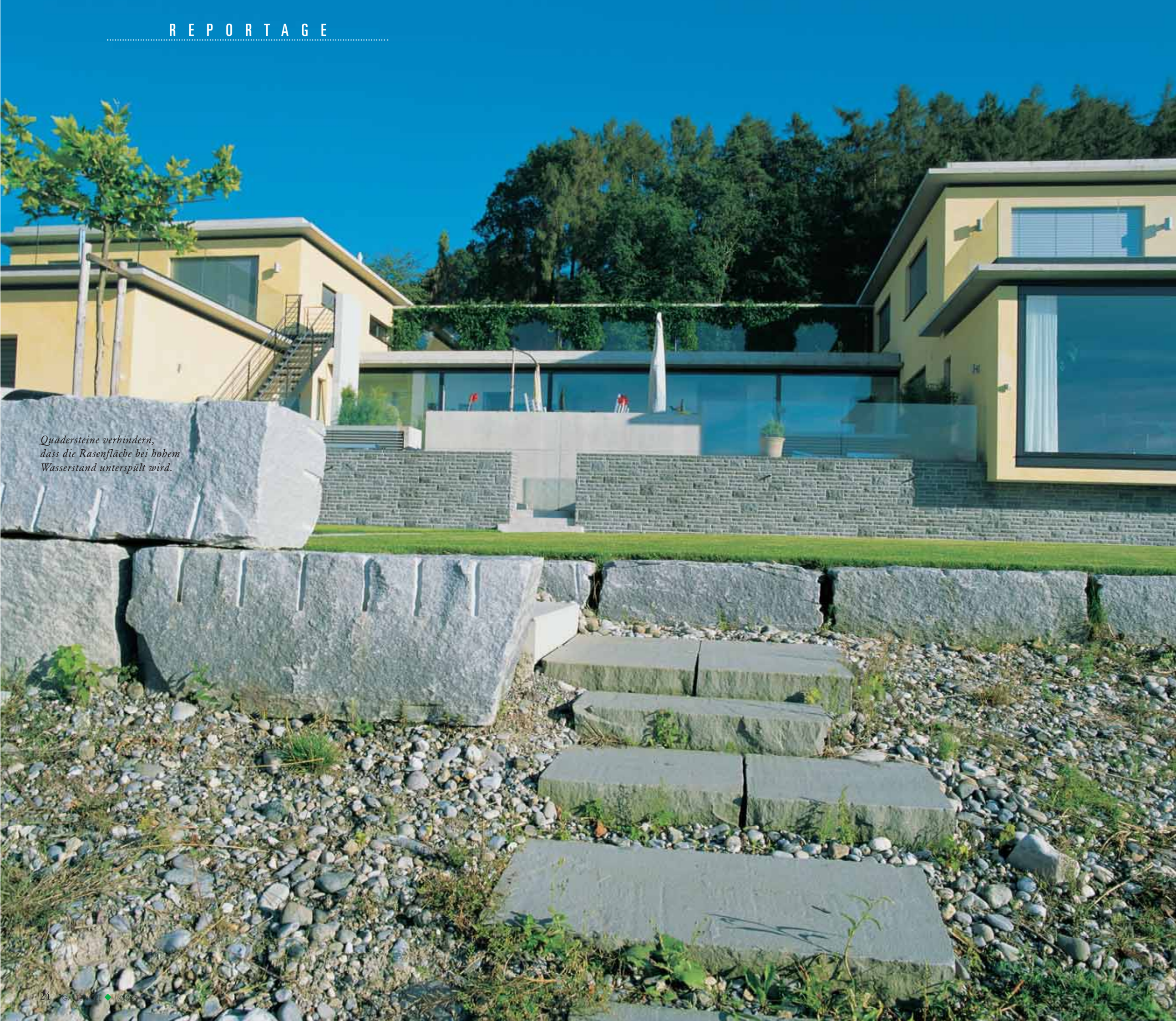
Quadersteine verbinden, dass die Rasenfläche bei hohem Wasserstand unterspült wird.