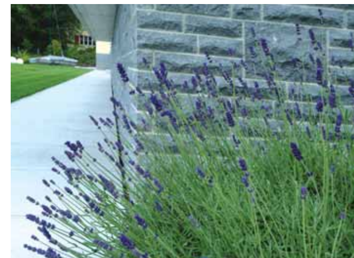
Lavendel, einer der wenigen speziell gesetzten Farbpunkte.