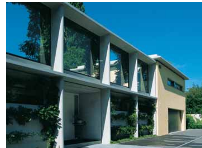
Die rechteckigen Durchblicke sind aus Schallschutzgründen mit Glas gefüllt.