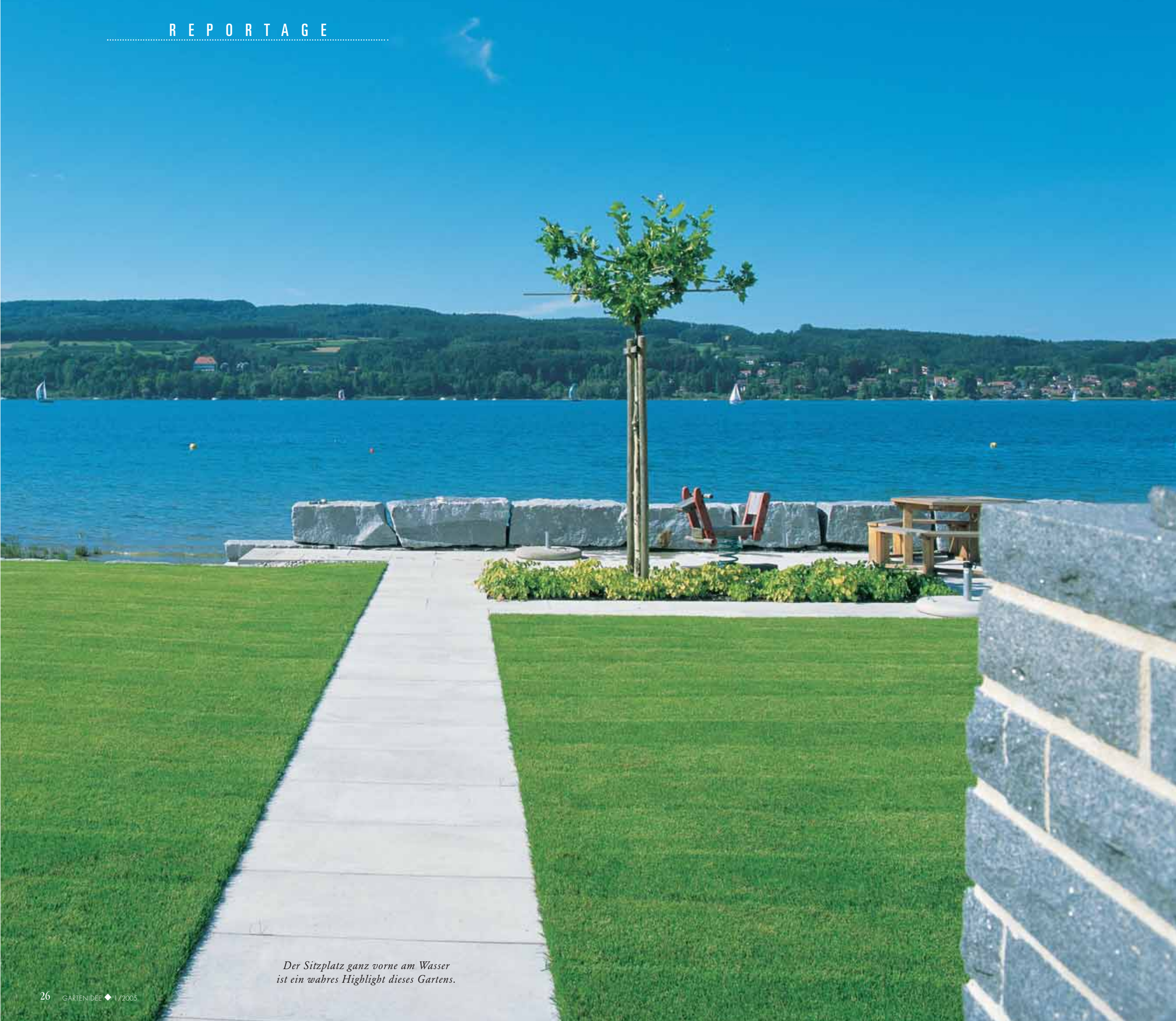
Der Sitzplatz ganz vorne am Wasser ist ein wahres Highlight dieses Gartens.