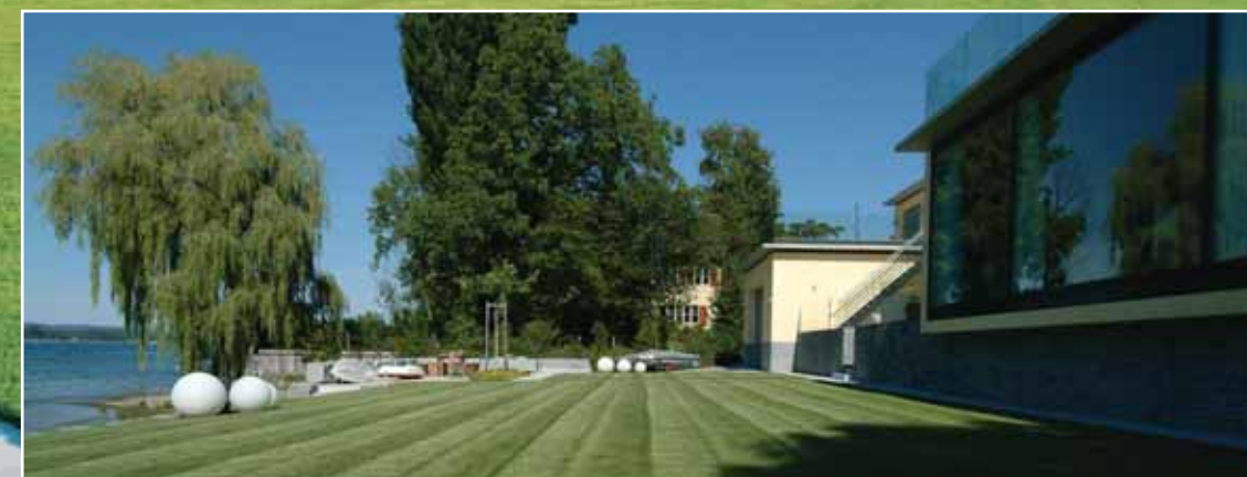
Die Trauerweide auf dem Nachbargrundstück beeinflusst stark den Charakter des östlichen Gartenteils.