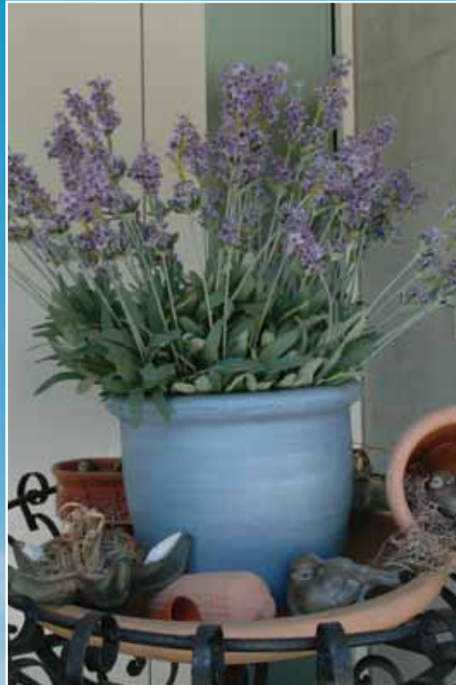
Arrangement mit Lavendel aus dem Garten.