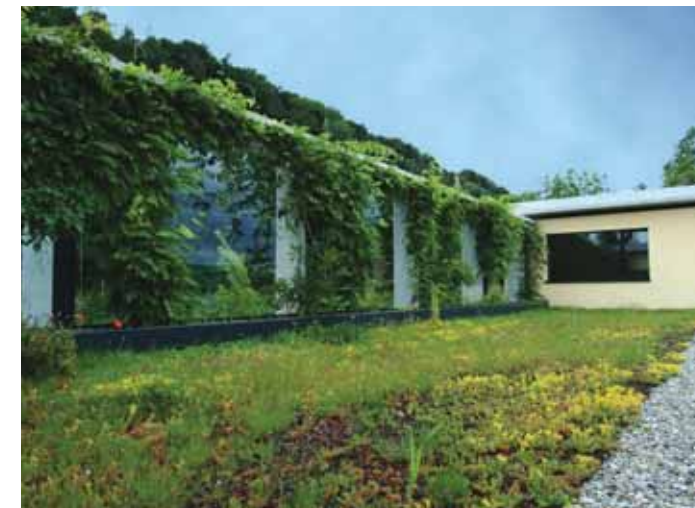
Auch die oberste Terrasse ist gegen die Strasse hin geschützt.