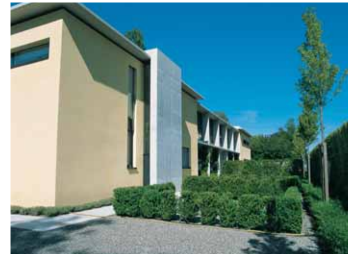
Mit den Jahren werden die hochstämmigen Bäume den Schallschutz zur Strasse deutlich verbessern.