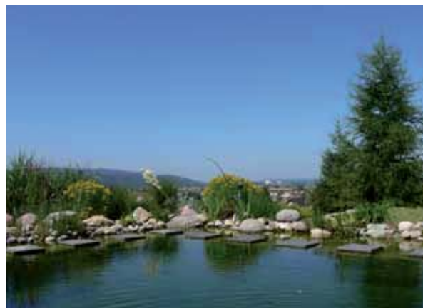
Ausblicke an gezielter Stelle schaffen Weite.