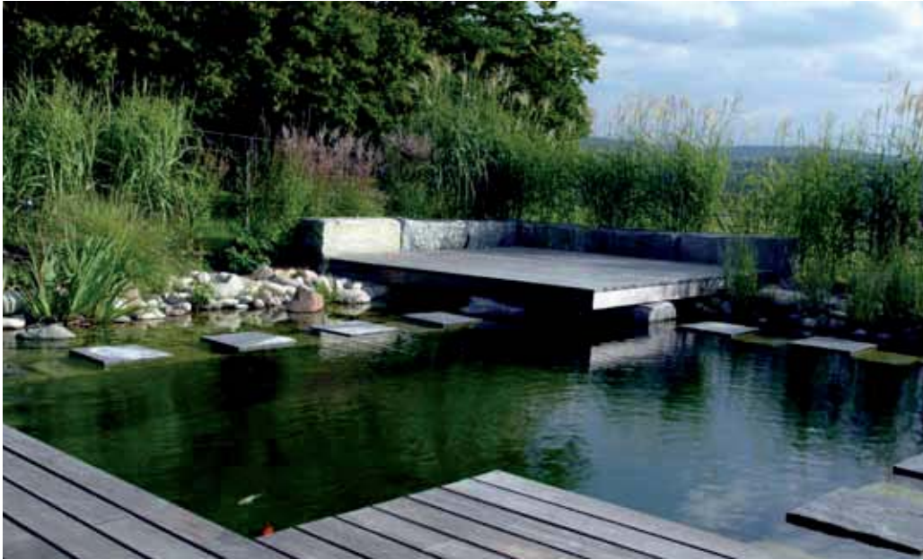
Perfekt zum Sonnen, Relaxen und Fische beobachten: Holzdeck mit Sitzsteinen.

Dieser Schwimmteich ist die Attraktion des Gartens. Er ist der Blickfang aus dem Wohnzimmer und sollte daher zu allen Jahreszeiten attraktiv sein. Viel Rücksicht nahmen die Besitzer bei der Planung auf ihre Kinder, die sich einen Fischteich wünschten, in dem sie auch baden dürfen.