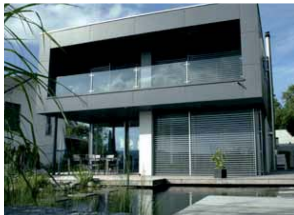
Der Wassersitzplatz ermöglicht den Blick aufs Haus.

Wie das Haus ist auch der Aussenraum hier leicht erhöht angelegt, um von der oberen Rasenterrasse ebenfalls die Aussicht geniessen zu können. So bietet dieser Garten vielseitige Nutzungsmöglichkeiten und einen Schwimmteich, der zu jeder Jahreszeit einen erfrischenden Anblick bietet.