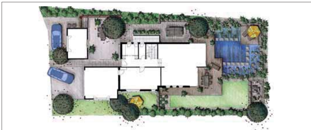
Plan: Grünplan GmbH, Kreuzlingen

Angrenzend an den Schwimmteich schmiegt sich eine kleine L-förmige Rasenfläche an und schafft so einen ruhigen Gegenpol zum Belebten. Etwas tiefer gelegen befindet sich ein südorientiertes, offenes Terrarium für Schildkröten. Durch die zweite Ebene und eine Einfassung aus Natursteinquadern kann auf die Einzäunung verzichtet werden. Ein grosszügiger Holzrost umfasst die südwestliche Hausecke, sodass der Hauptsitzplatz genügend Platz zum sommerlichen Grillieren bietet. Auf eine dichte Strauchbepflanzung zum angrenzenden Nachbargrundstück wurde verzichtet, um die Grosszügigkeit zu erhalten. Im hinteren Gartenbereich laden